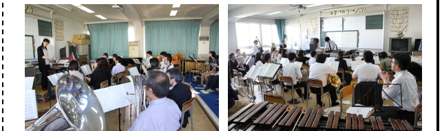
指導者講習会の様子

テランまで、指導者が指揮者・演奏者を体験し、意見交流する相互研修会を開催いたしました。和歌山県内各地からあらゆる世代の指導者・奏者にご参加いただきました。奏者を経験された指導者からは、「久しぶりに演奏できて楽しい」「他の先生がどのように指導されているか体験できた」また指揮を担当された指導者の方からは「学校でできないことができる貴重な時間でした」とお互いに和気あいあいとした楽しい講習会となりました。