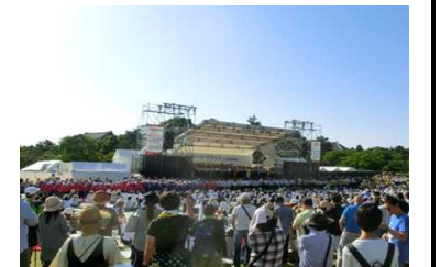
あおぞら吹奏楽 全ての出演者による“風になりたい”の大合同演奏でエンディング

者と多数の観客の皆さんによって、今年も“吹奏楽の可能性と社会的な役割”を実証できたコンサートになりました。ロケーションも奈良ならではの、修学旅行生や外国人観光客で溢れかえる中でしたが、出演者の皆さん、運営にご協力いただいた皆さんに感謝申し上げます。コンクール以降、例年通りの事業を行ってまいります。コンクール以降、例年通りの事業を行ってまいります。コンクール以降、例年通りの事業を行ってまいります。